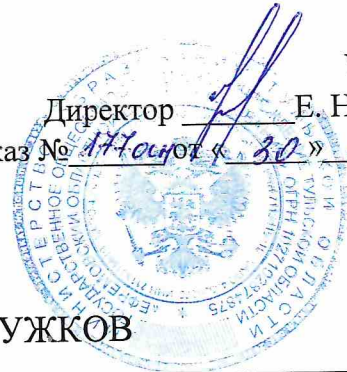
ГРАФИК РАБОТЫ КРУЖКОВ